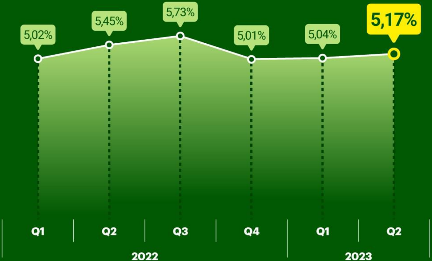
Pertumbuhan Ekonomi Indonesia (2022-2023) Berdasarkan Y-ON-Y (Dalam %)

Badan Pusat Statistik (BPS) melaporkan ekonomi Indonesia triwulan II 2023 tetap tumbuh positif sebesar 5,17% terhadap triwulan II-2022